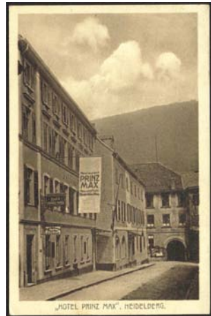
Das ehemalige Hotel Prinz Max in der Marstallstraße auf einer Postkarte von 1910

Am 1. August 1914 wurde die Erklärung des Kriegszustandes verkündet. Zuvor wurde noch am 29. Juli 1914 im Hotel Prinz Max in der Marstallstraße eine Protestversammlung der SPD gegen den drohenden Krieg abgehalten. Das Hotel Prinz Max wurde später zu einem Reservelazarett umfunktioniert, wie ein Feldpostkarte vom 30. August 1915 zeigt. Der Briefstempel zeigt hier einen Einkreisstempel mit dem preußischen, gekrönten Adler.