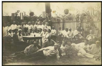
Im Rohrbacher Schlässchen: Vom Genesungsheim zum Lazarett war nur ein kleiner Schritt.