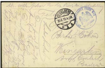
Eine Feldpostkarte vom 30. 8. 1915 mit dem Briefstempel „Reservelazarett Prinz Max“

Die Heidelberger Stadthalle, erst 1903 fertig gestellt, wurde gleich zu Kriegsbeginn vom Roten Kreuz als Vereinslazarett eingerichtet. Zu Anfang belegt ein Einzeiler vom 11. September 1914 die Situation auf einer Feldpostkarte. Hierzu wurde eine Fotografie von Verwundeten und Rotkreuz-Schwestern auf einem Nordbalkon der Stadthalle verwendet.