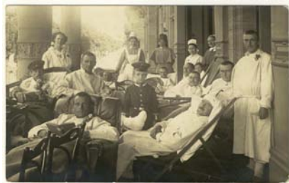
Die Fotoseite: Verwundete auf einem Nordbalkon der Stadthalle