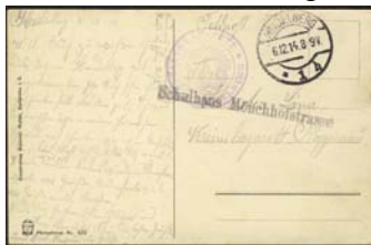
Briefstempel Reservelazarett mit zusätzlichem Formularstempel Schulhaus Mönchhofstrasse