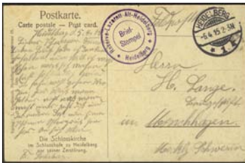
Schön lesbarer Briefstempel vom Reserve-Lazarett-Alt-Heidelberg

Außer dem Hotel Prinz Max wurden weitere Hotels für Reservelazarette requiriert: Hotel Alt-Heidelberg in der Rohrbacher Straße und das Hotel Schrieder, Ecke Rohrbacher Straße / Bahnhofstraße, heute das Hotel Crowne Plaza.