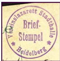
Briefstempel der Stadthalle als Vereinslazarett bis zum 30. September 1916

Später wurde ein Einkreisstempel mit der Bezeichnung „Vereinslazarett“ als Briefstempel eingesetzt. Und nachdem ab 1. Oktober 1916 die Stadthalle als Reservelazarett durch das Militär verwaltet wurde, wurde ein weiterer Briefstempel jetzt mit der Bezeichnung „Reservelazarett“ eingesetzt. Dieses Reservelazarett erhielt jetzt eine Ordnungsnummer XVIII.