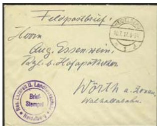
Briefstempel der Landhausschule als „Res. Lazarett II“

Weitere wichtige Reservelazarette waren in der Landhausschule (Landhausstraße) und in der Mönchhofschule (Mönchhofstraße) untergebracht.