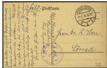
Briefstempel des Res.- Lazarett XV Schrieder

Weitere Reservelazarette waren die Fechtschule, ehemals in der Schiffgasse, und die Gewerbeschule im Marstall-Gebäude.