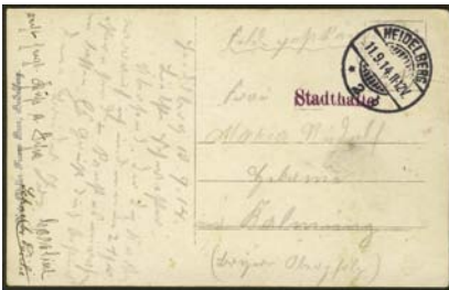
Feldpostkarte mit dem Briefstempel „Stadthalle“

Die Heidelberger Stadthalle, erst 1903 fertig gestellt, wurde gleich zu Kriegsbeginn vom Roten Kreuz als Vereinslazarett eingerichtet. Zu Anfang belegt ein Einzeiler vom 11. September 1914 die Situation auf einer Feldpostkarte. Hierzu wurde eine Fotografie von Verwundeten und Rotkreuz-Schwestern auf einem Nordbalkon der Stadthalle verwendet.