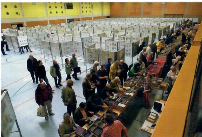
Man nehme... eine große Sporthalle und zaubere eine Ausstellung daraus.