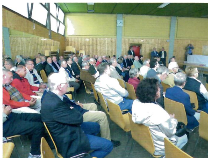
Bei der Eröffnung war auch der letzte Platz im großen Rund besetzt.

Die Ausstellung hatte das Consilium Philatelicum eingeladen, passend zu den Gästen der ArGe Baden und aus den USA einen bunten Themenkreis zu offerieren. Ein dreitägiges