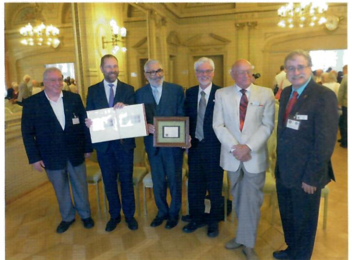
Bürgermeister, Vereins- und BDPH-Vertreter stellen sich beim Empfang der Stadt Heidelberg mit den Gästen der GPS aus den USA den Fotografen.