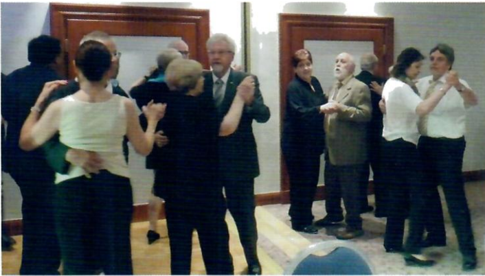
Ein Festabend mit Tanz? Lange nicht mehr erlebt!

Auch die Zusatzveranstaltungen waren stets gut besucht: von Eröffnung bis Weinabend, natürlich auch der Festabend. Man genoss, wie man so nett sagt, in vollen Zügen.